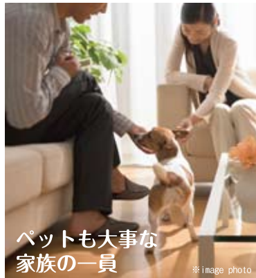
ペットも大事な 家族の一員